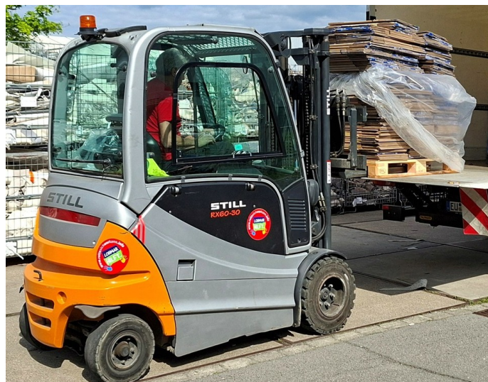
Der Staplerfahrer von Zentis war eine große Hilfe

15 Paletten hatten wir geordert, 3 haben wir noch on Top gestapelt, es waren also insgesamt 18.