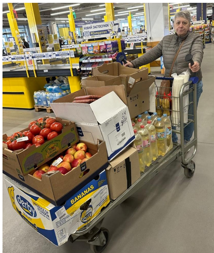
Einkauf mit unseren Spendengeldern

Im Rahmen der Veranstaltung wurden Spenden für Waisenkinder mit Behinderung in der Ukraine gesammelt. Dank der großen Unterstützung der Besucher konnte eine wertvolle Hilfe für die betroffenen Kinder ermöglicht werden. Die Spenden wurden genutzt, um den Kindern notwendige Versorgung, Unterstützung und kleine Momente der Freude zu schenken.