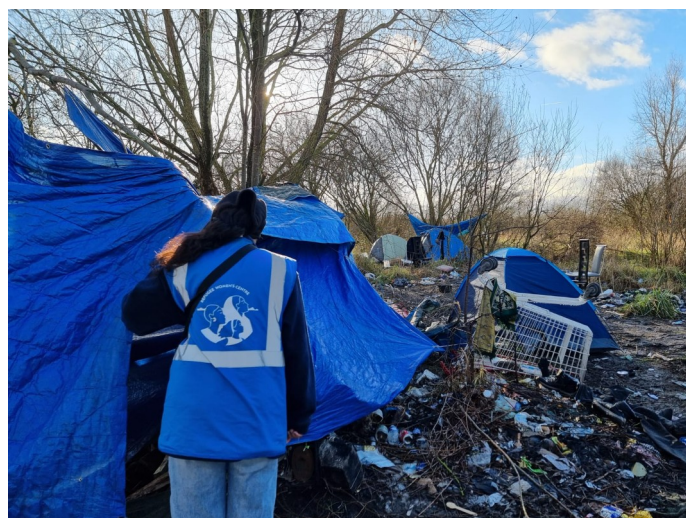
Ehrenamtliche vom Refugee Womens Center