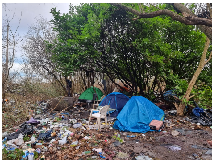
Zeltlager in Nordfrankreich

Die Situation auf der Kanalroute – dem Migrationspfad vom europäischen Festland über den Ärmelkanal in das Vereinigte Königreich – ist nach wie vor krisenhaft: Menschen leben in provisorischen Zeltcamps bei Calais und Dunkerque. Diese werden regelmäßig geräumt und bilden sich danach neu. Die Versorgung der Menschen mit Wasser, Lebensmitteln, Internetzugang, Kleidung, Information und rechtlichen Ressourcen wird noch immer hauptsächlich von der Zivilgesellschaft geleistet. Der Küstenstreifen, von dem aus Menschen die gefährliche Bootspassage beginnen, reicht etwa von der belgischen Küste bis zur Somme-Mündung. Einschüchterungen durch und Angst vor Schleusern ist für viele Alltag. Und nach wie vor versuchen Menschen ebenfalls, statt per Boot in einem Lastwagenversteck den Kanal zu passieren.