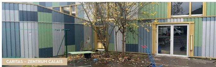
Die Caritas - vorher

Das diesjährige Bauprojekt fand in der Woche vor Ostern in Calais statt - einem Ort, an dem viele geflüchtete Menschen, zu unserer Zeit hauptsächlich junge Männer aus dem Sudan und Eritrea, auf der Suche nach einer Zukunft in England "stranden" und auf eine Überfahrt über den Ärmelkanal hoffen.